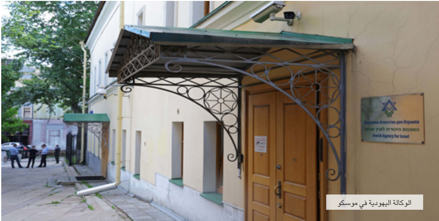
الوكالة اليهودية في موسكو

سواء في سوريا ام في إيران، وبغياح سياستها. كما أنهم يرون عدم الجدية والاعتبارات الغربية في القرارات، ولا يبدسون بينت شفة. ذلك المستوى الذي يواصل تقديس الاعتبار التكتيكي، رغم أنه يفترض أن يفهم السخافة الاستراتيجية. كان يمكن وينبغي توقع أكثر من ذلك منه».