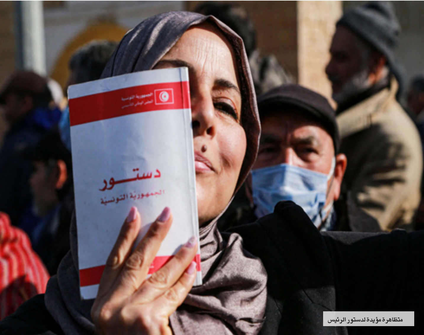
متظاهرة مؤيدة لدستور الرئيس

وبأنّ "مدينة الدولة جاءت في ظل مناورات..". ما دفع بالرصد الوطني للدفاع عن مدينة الدولة في بيان له، إلى اعتبار أنّ التخلي عن مبدأ مدينة الدولة في الدستور الجديد وإعمال التخصيص على المبادئ الكونية لحقوق الإنسان يُعتلّان خطرا على الدولة التونسية لما سيؤدّيان إليه من تراجع في الحقوق والحريات، ويدعو على هذا الأساس إلى النضال بكل الطرق السلمية التي يكفلها القانون من أجل إعادة التخصيص على هذا المبدأ في الدستور، ومن أجل