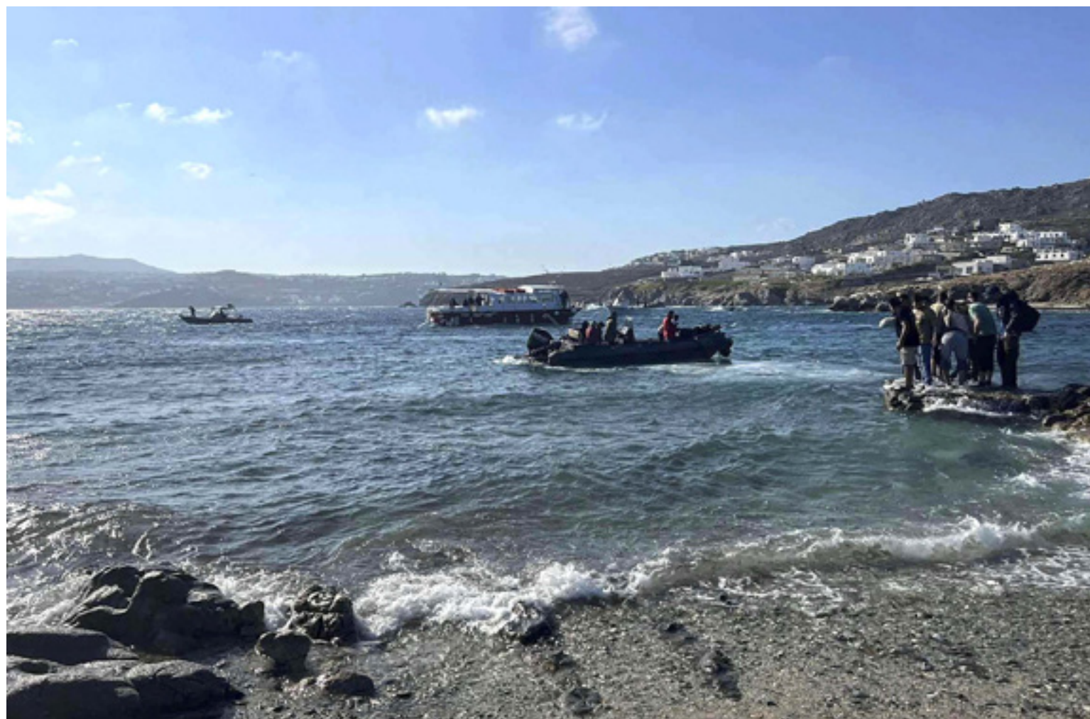
إسطنبول – «القدس العربي»: إسماعيل جمال

بات المهاجرون الذين يحاولون الوصول من تركيا إلى اليونان براً وبحراً الضحية الأولى لتصاعد الخلافات بين البلدين في السنوات الأخيرة، وسط حوادث متكررة لملاحقة وإغراق سفن المهاجرين وأخرى لتعذيب وقتل لاجئين وسط اتهامات متبادلة بين أنقرة وأثينا واتهامات أخرى طالت وكالة حماية الحدود الأوروبية «فرونتكس» التي تتهمها تركيا بالمشاركة في عمليات ملاحقة وقمع المهاجرين وسط البحر.