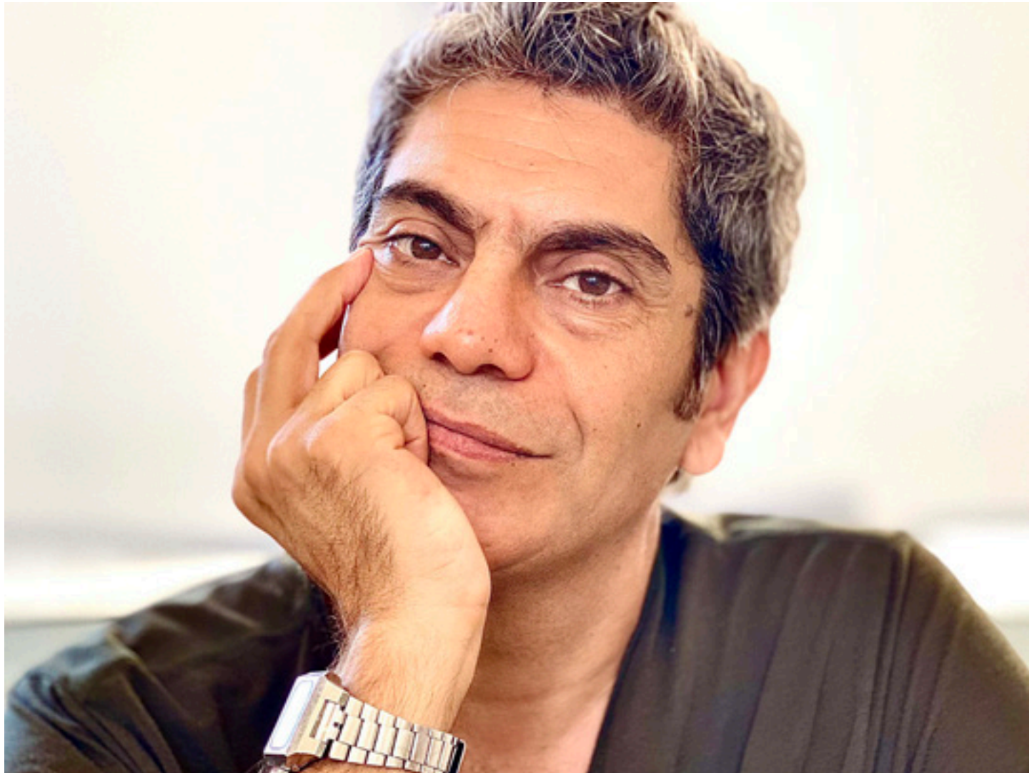
بيروت – «القدس العربي»: زهرة مرعي

يلاحق التأهب مُشاهد فيلم "بيروت هولدم". أحداثه تكبر وتتوالى وتتجرّج كذلك. فيلم صوب الكاميرا على طبقة وسطى نصف مسحوقة في لبنان. حي شعبي تشغله الحركة، ويسلب عقول مجمل سكانه مبدأ المراهنة والقامرة الرهيبة. عن هؤلاء الناس تحدّث الفيلم الذي أنجزه المخرج ميشال كمون وبدأ العمل في الصالات المحلية قبل أيام.