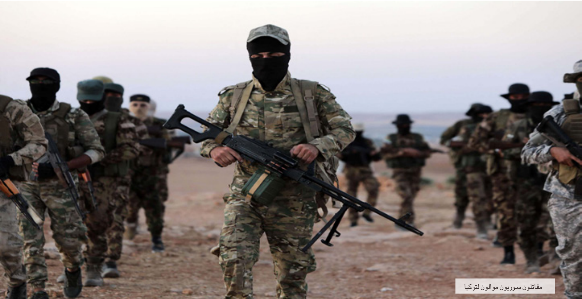
مقاتلون سوريون مولون لتركيا

من المستغرب أن تعضب المعارضة السورية الموالية لتركيا من تصريحات الوزير التركي، فمُنذ سقوط حلب أو صفقة تسليمها للنظام السوري لم تترك الاستدارة التركية تجاه القضية السورية ورغم أنها جرت جدا إلى استانة وقبيل بالसार الذي قبلته تركيا مرغمة مع روسيا وإيران. ولم تتعط المعارضة السورية من اتفاق خفض التصعيد الذي أقرس "بتادق الثوار" وأسقط المناطق بيد النظام في الغوطة الشرقية ودرعا وريف حمص الشمالي حتى جاء دور منطقة "خفض التصعيد" الزابعة في إدلب وما حولها والتي قضمها النظام بثلاث مراحل متلاحقة. منعت الفصائل استخدام سلاحها ضد النظام في حين أطلق بتصفية بعضها البعض في جولات قتال لا تنتهي، حتى انطبق القول الساخر على المعارضة "المفاجئ في الأمر، أنها دائما تتفاجأ".