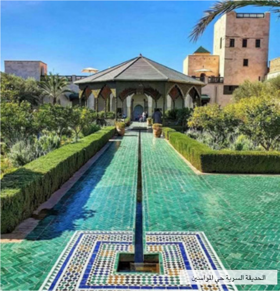
الحديقة السرية حي المواصلين

أغمات التي كانت مزدهرة خفت نجمها في فترة حكم الموحدين، وتحولت من مركز سياسي وتجاري إلى مدينة هامشية دخلت في طي النسيان، وقد جاء في وصفها من