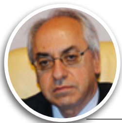
عبد الباسط سيدا