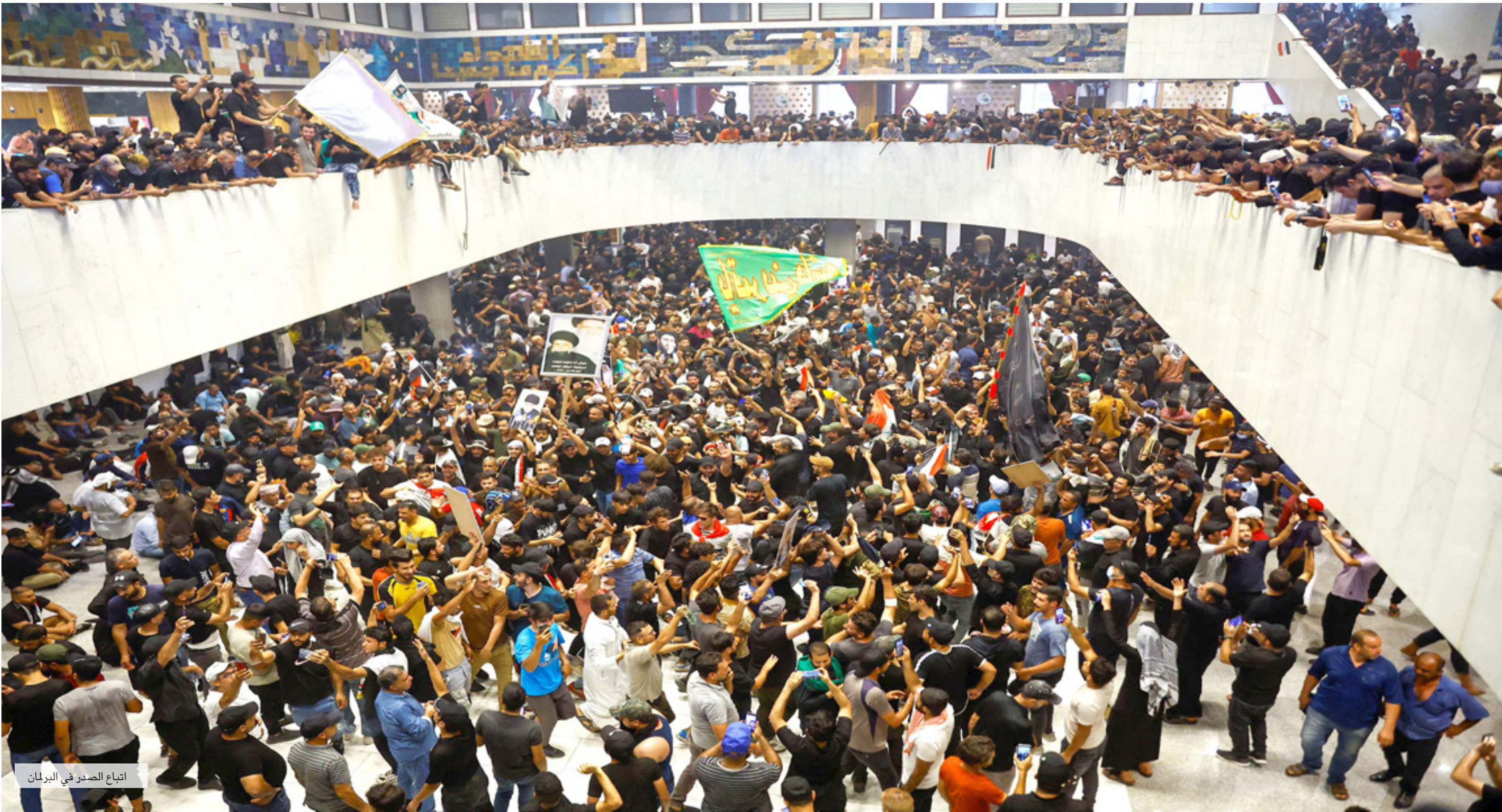
اتباع الصدر في البرلمان

الكونكريتية، فضلاً عن غلق مداخل المنطقة الدولية، خصوصاً تلك القريبة من مجلس القضاء الأعلى.