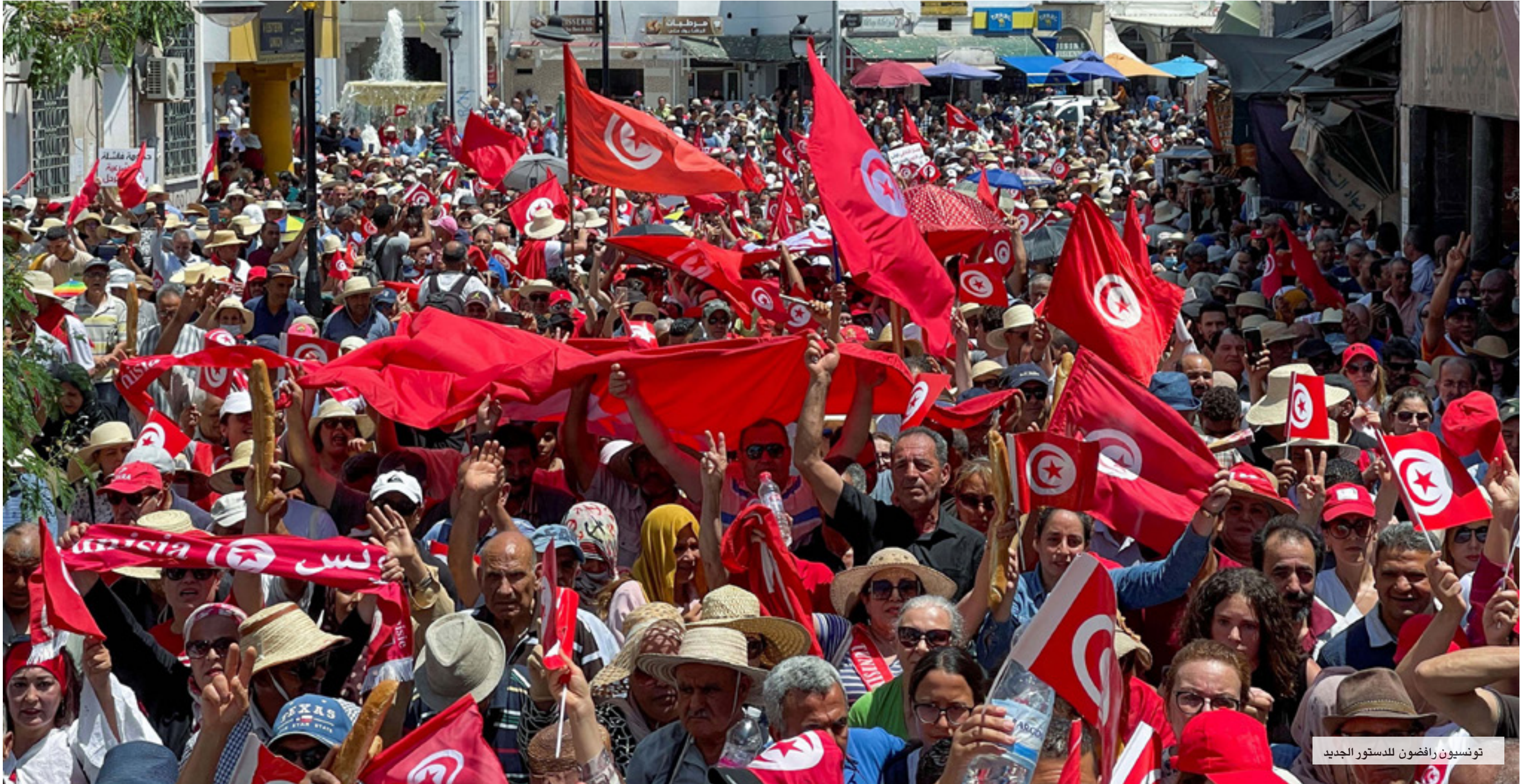
تونسيون رافضون للدستور الجديد

ويتنظر أن تضغط هذه المنظمات ورجال القانون والقوى الديمقراطية باتجاه إدخال التعديلات اللازمة على نص الدستور الذي جاء مخيبا لآمالهم في مسألتي الحريات وسير عمل النظام السياسي. إذ يجب حسب هؤلاء استبدال عبارة رئيس الحكومة بعبارة الوزير الأول كما النظام الرئاسي الفرنسي أو حذف هذه الخطة تماما أسوة بالنظام الرئاسي الأمريكي مع إخضاع صاحب السلطة التنفيذية والصلاحيات الواسعة أي رئيس الجمهورية إلى الرقابة والمحاسبة والمسائلة لضمان