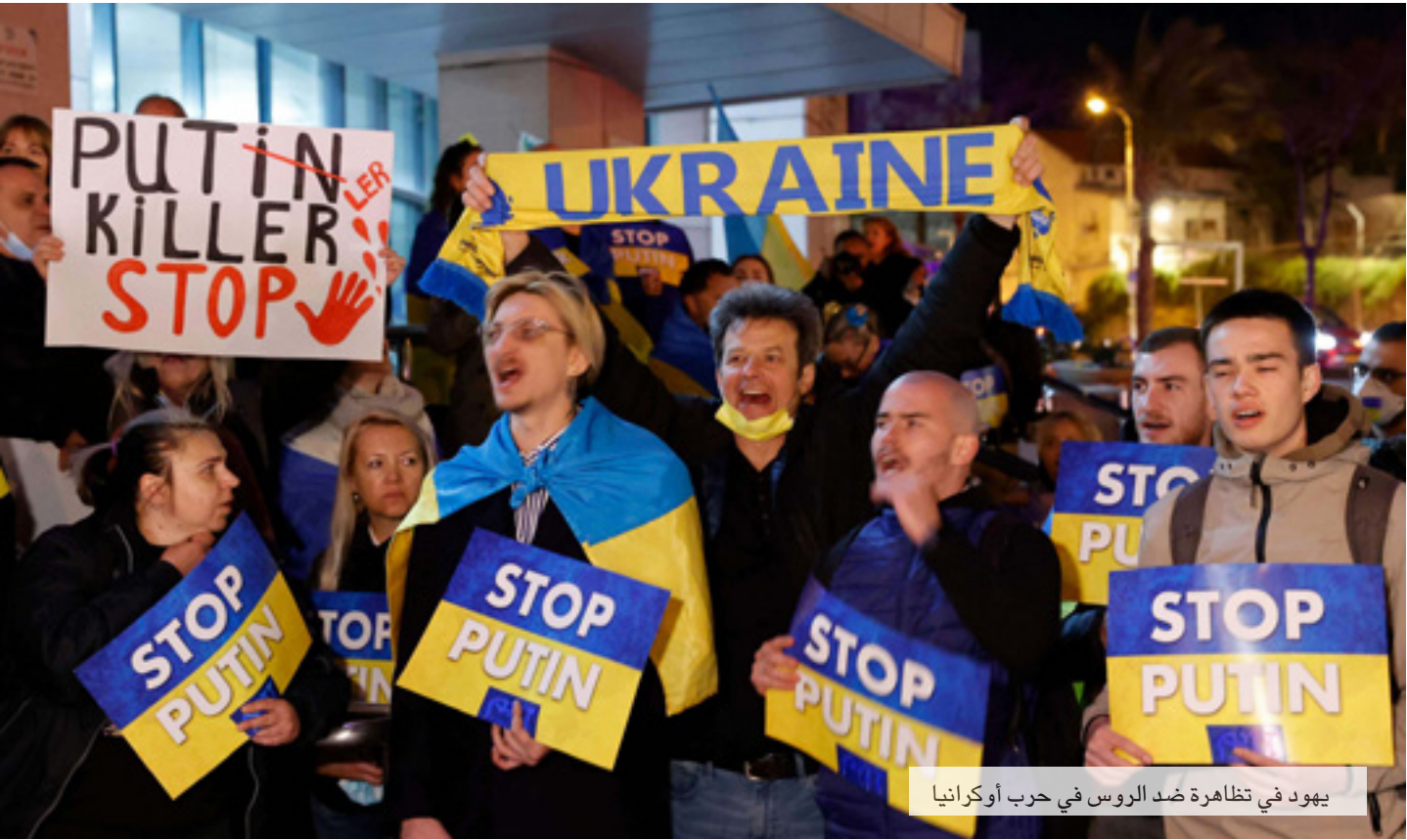
يهود في تظاهرة ضد الروس في حرب أوكرانيا

ويتنقد الباحث الصحفاني الإسرائيلي عوفر شيلخ المواقف الإسرائيلية حيال روسيا، ويرى أنها مصابة بحسابات غربية. فيقول في مقال نشرته «معاريف» إن الموقف في وسائل الإعلام الإسرائيلية: تتبين أن ليوتين الذي هو الآن في ذروة صراع مصيري على استمرار حكمه وإرثه ومستقبل اقتصاد روسيا ومكانها في المراتبية