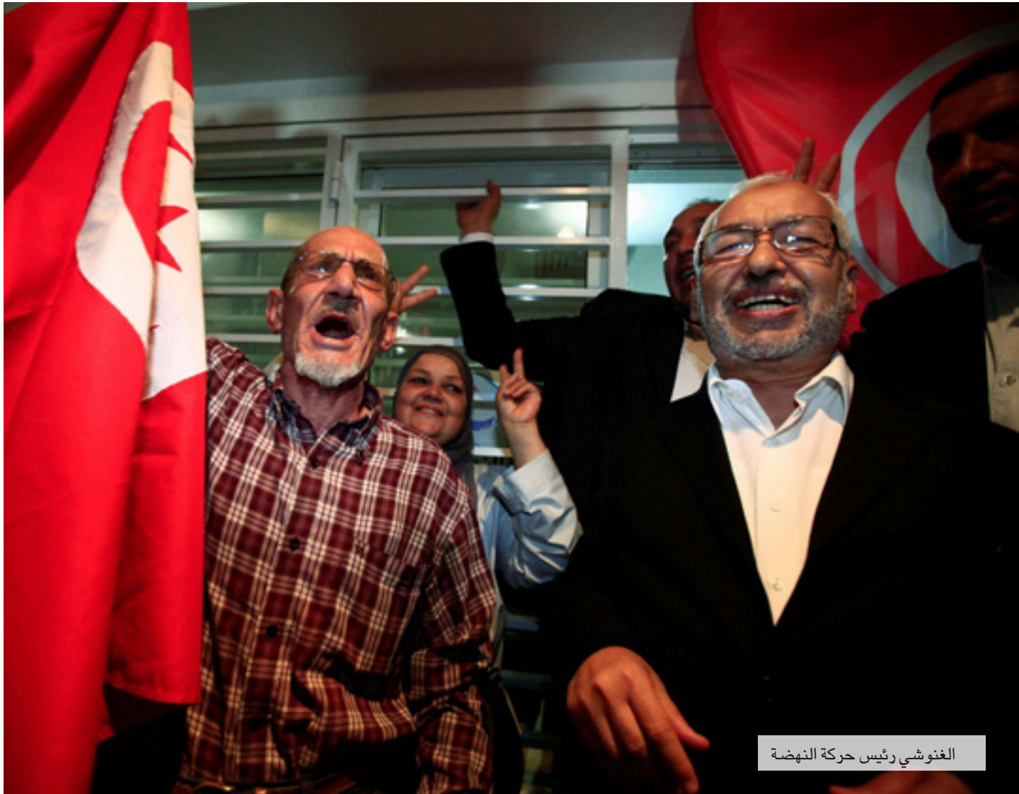
الغنوشي رئيس حركة النهضة

محلية حول تصوره للقانون الانتخابي المقبل سوى ان يقول بأنه يأمل ان يتم اعاده بصفة تشاركية" وأن نستمتع لبعضنا البعض". لكن المآزق الحقيقي لا يمكن فقط في المؤيدين الظاهرين لقيس سعيد، بل في معارضيه العلنيين أيضا. فهؤلاء فشلوا وعلى امتداد عام كامل في تشكيل معارضة موحدة ومتراصة الصفوف وبقوا معارضات متفرقة ومشتتة ومتشظية وفي أحيان كثيرة مختلفة ومتباعدة عن بعضها البعض بل وحتى متصارعة ومتنافسة فيما بينها في بعض المرات. ولأجل ذلك فليس هناك حتى الآن أي موقع مشترك حول الخطة أو الطريقة التي ستعامل بها الأحزاب والقوى السياسية والاجتماعية الرافضة لسار الرئيس مع المرحلة المقبلة. لقد اكتفت جبهة الخلاص الوطني وهي تتكل بضم خمسة أحزاب هي "حزب حركة النهضة" وحزب قلب تونس" و"ائتلاف الكرامة" وحراك تونس الإرادة" و"حزب الأمل" بأن كل الأحزاب والقوى السياسية والاجتماعية الرافضة لسار الرئيس مع المرحلة المقبلة على حاله؟ ناشدت في بيان لها الثلاثاء الماضي "القوى الوطنية السياسية والمدنية فتح مشاورات عاجلة لعقد مؤتمر للحوار الوطني" الذي شدد حمة الهمامي أمين عام حزب العمال اليساري وهو طرف في "الحملة الوطنية لإسقاط الاستفتاء" والمكونة من الحزب الجمهوري وحزب التيار الديمقراطي والتكتل الديمقراطي من أجل العمل والحريات وحزب القبط وحزب العمال على انه ينبغي على المعارضة ان تتوحد فيما قبل القوى الديمقراطية والثورية والتقدمية لإسقاط هذا المسار وهذا المشروع من دون ان يحدد الطريقة التي يمكن ان يحصل بها ذلك. لكن رئيس حركة النهضة وهي أكبر الأحزاب في تونس لح إلى واحد من أكبر الأسباب التي تحول الآن دون توحيد قوى المعارضة